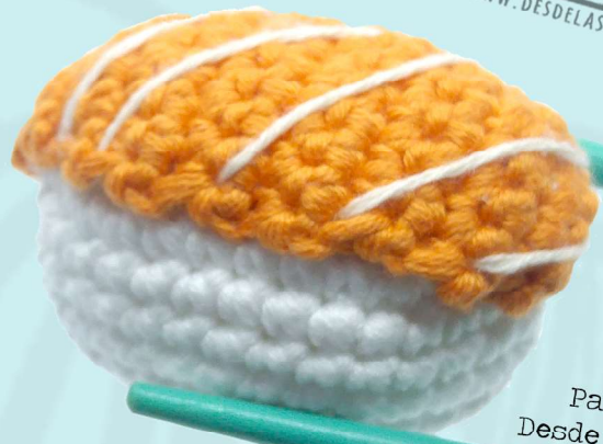
Patrón de Desde las Nubes